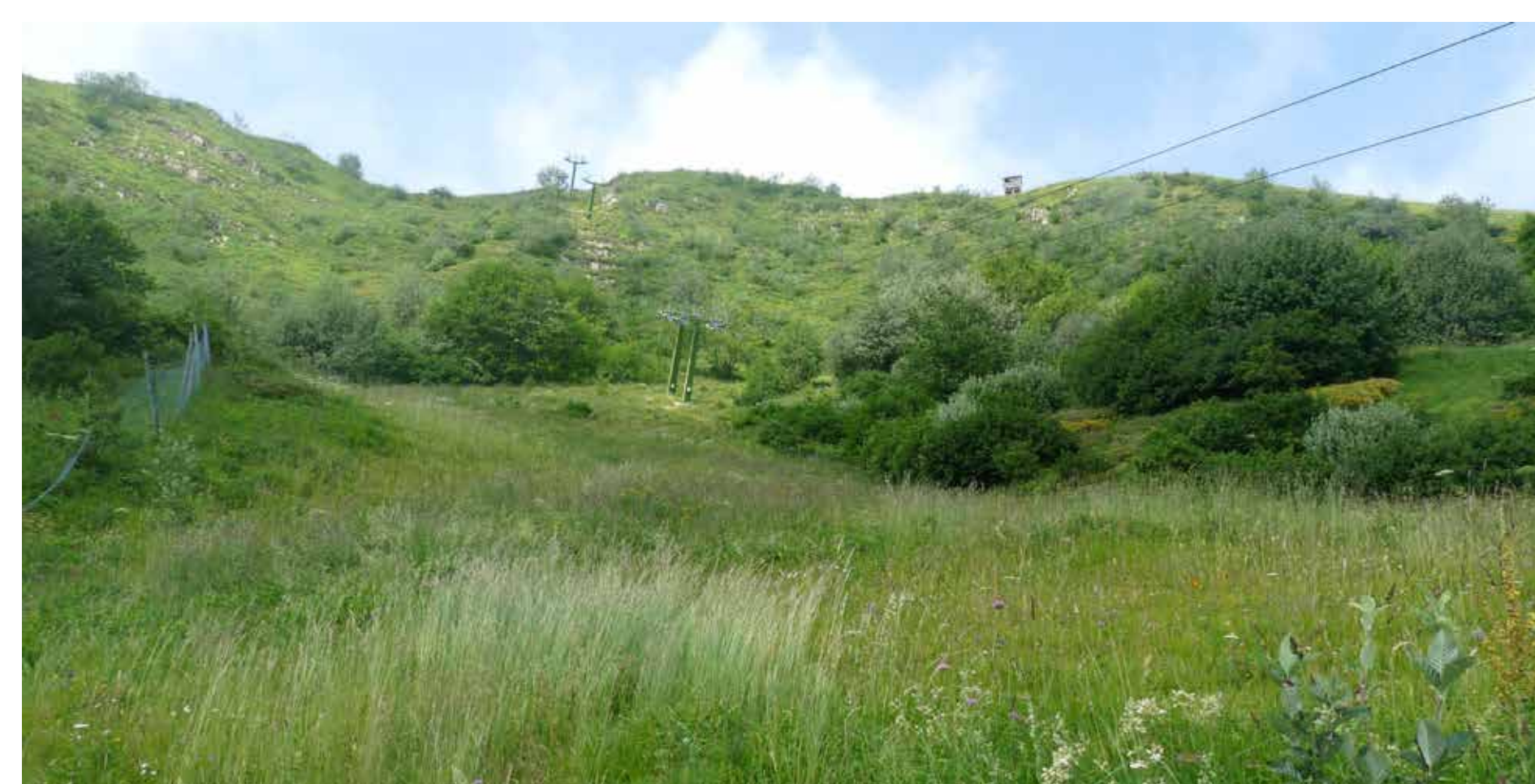
Vista del versante orientale del Chiappo