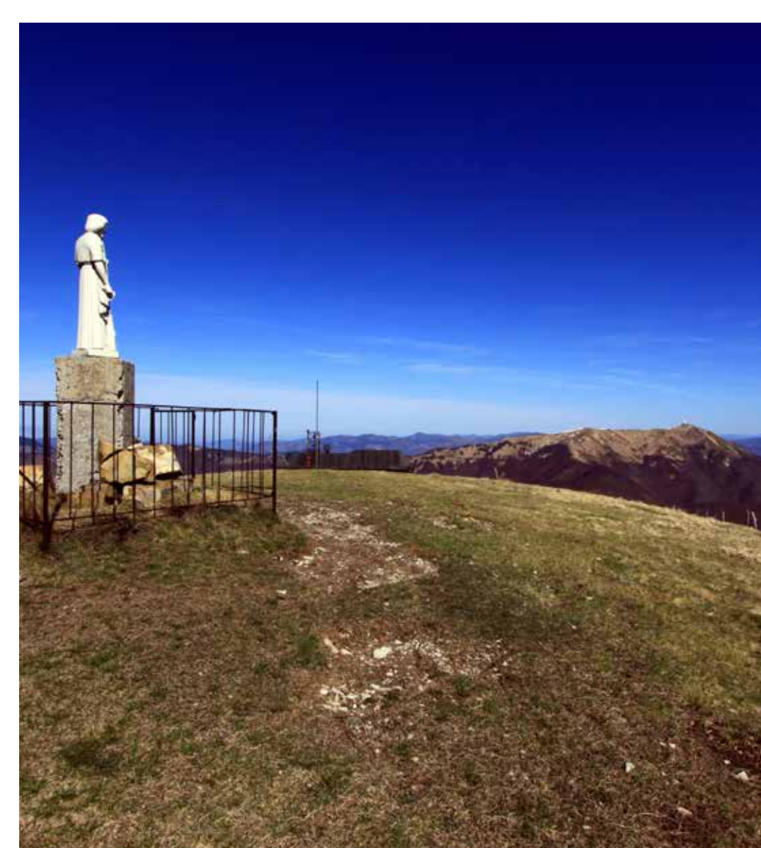
La vetta del Monte Chiappo dominata dalla statua dedicata a San Giuseppe